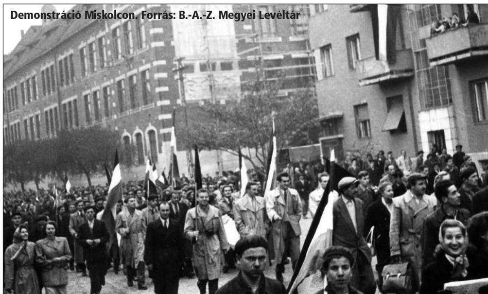
Demonstráció Miskolcon.