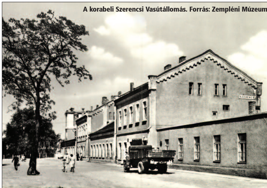
A korabeli Szerencsi Vasútállomás.