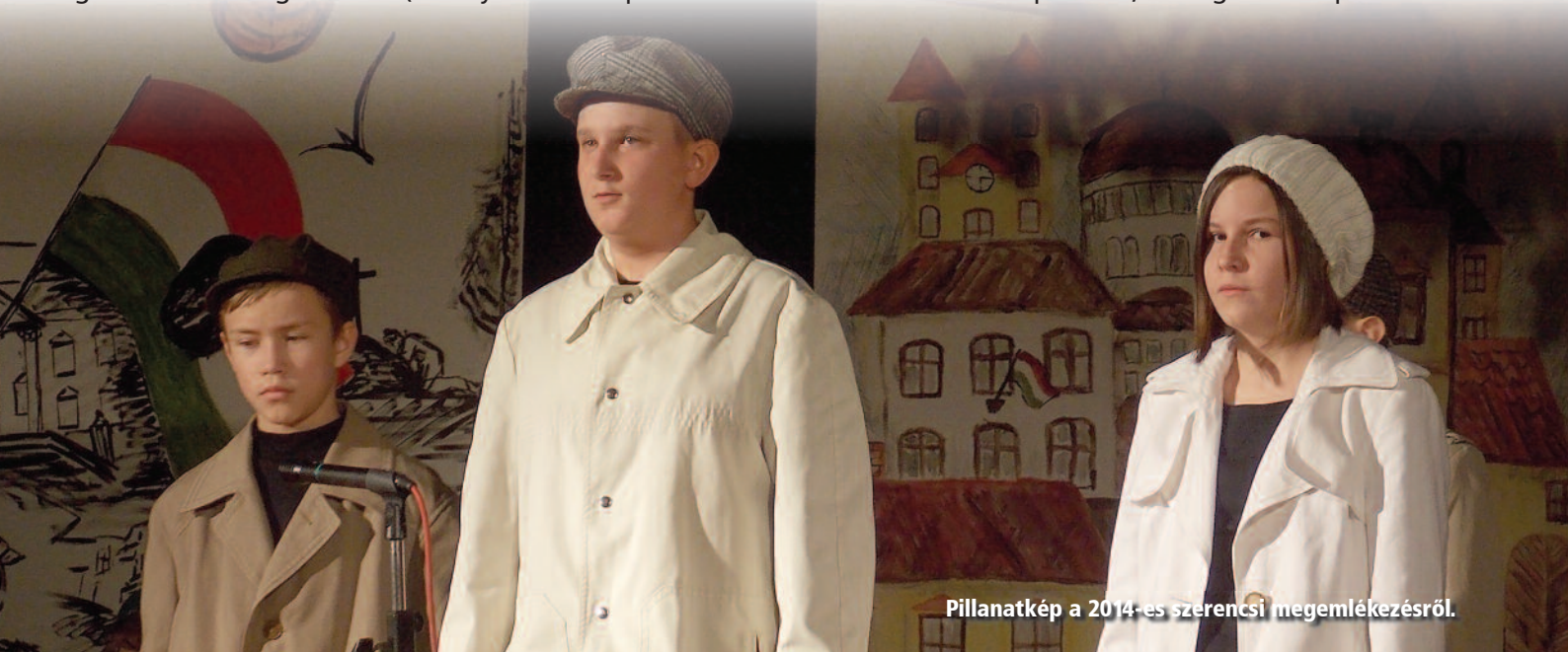
Pillanatkép a 2014-es szerencsi megemlékezésről.

pontjukat mintegy 150-en. A szovjetek november 9-én – megszállva az odavezető utakat – a csoport felszámolására készültek. Kummert Károly, belátva a harc kilátástalanságát, a felajánlott fegyverletételi feltételeket elfogadta. Annak értelmében szabadon eltávozhattak, sőt, a kapitulálókat gépkocsin hazaszállították. A szerencsi nemzetőrök éltek is ezzel a lehetőséggel. A fegyveres ellenállás utolsó szikrája ezzel kihunyott. A szovjet segítséggel uralomra került új hatalom a járási, községi, üzemi munkástanácsok uralmát még hosszú hetekig nem tudta megtörni. November 9-én a nemzetőrség is feloszlott Szerencsen, az eltávozók lepecsételt, aláírt igazolást kaptak.