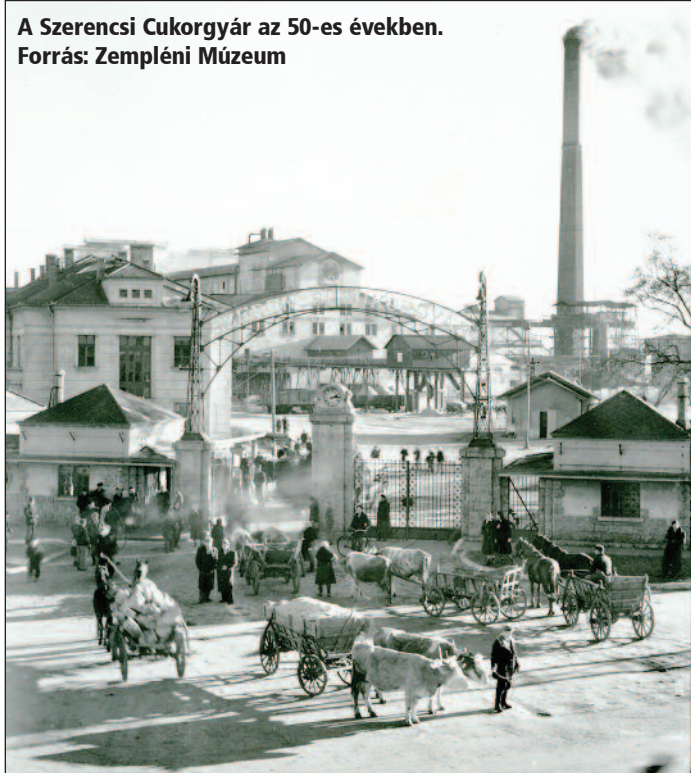
A Szerencsi Cukorgyár az 50-es években.

rolt szeszféleségek megfelelő őriztetéséről gondoskodjanak. A készletből további intézkedésig kiadni nem lehet.