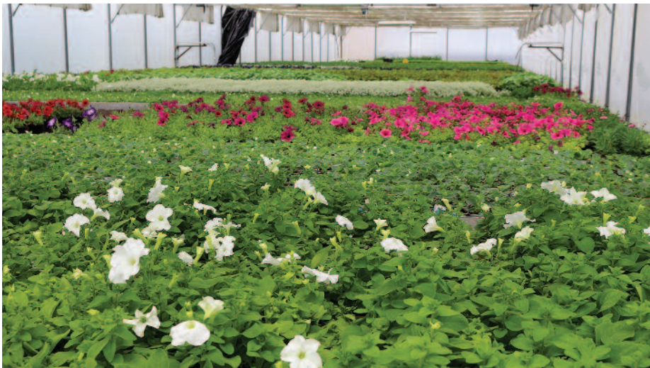
300 ezer virágot nevelnek a Szerencsi Városgazda Non-profit Kft. telephelyén.