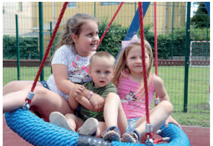
Nagy örömmel vették birtokba a játékokat a gyerekek.

Korábban már beszámoltunk arról, hogy a Zöld Város projekt keretében, Európai Unió támogatásából, új játszótérrel bővült Szerencs az Erzsébet téren. A beruházás júniusra elkészült, a gyerekek a szükséges engedélyek megérkezését követően a hónap végétől vehették birtokba a közösségi teret. Annak érdekében, hogy megóvják az illetéktelenektől az eszközöket zárható kerítéssel vették körbe a területet, így minden nap 8-20 óra között vehetik igénybe a családok a játékokat. Az ünnepélyes megnyitót július 4-én tartották a Szerencsi Művelődési Központ és Könyvtár szervezésében. A rendezvényen Nyiri Tibor polgármester köszöntötte a jelenlévőket, aki hangsúlyozta, hogy a gyermekek fejlődéséhez elengedhetetlen a játék, amihez biztonságos eszközök szükségesek. Az elkészült játszótér nagy segítséget nyújt ebben. Ezt követően a vidámság volt a főszerep. A kicsiknek Rita bohóc színes lufi figurákkal kedveskedett, valamint aszfaltrajversenyen élhették ki kreativitásukat a gyerekek, az önfelédet játék mellett. Az eseményen közreműködtek a szerencsi Logiklub tagjai is, akik frissítővel és aprósüteménnyel kínálták a résztvevőket.