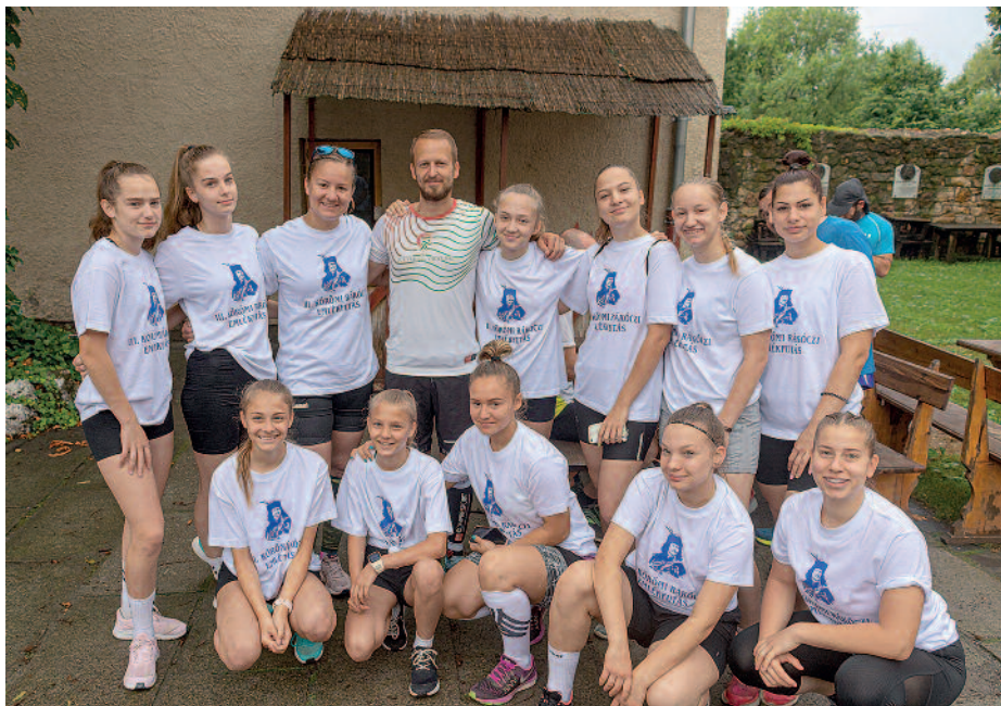
A Szerencs VSE sportolói is rajthoz álltak.

A III. Körömi Rákóczi Emlékfutást június 27-én rendezték meg, melynek kiindulópontja Szerencs volt. Az eseményt Tóth Tibor Köröm polgármestere, valamint Bánné dr. Gál Boglárka a Borsod-Abaúj-Zemplén Megyei Közgyűlés elnöke, nyitotta meg, aki üdvözölte a résztvevőket. Az emlékfutás ötlete 2018-ban fogalmazódott meg annak kapcsán, hogy II. Rákóczi Ferenc fejedelem Szerencsről indult Köröm irányába, az 1707. május 31. - június 22. közötti időszakra meghirdetett országgyűlés helyszínére, Bekecs, Taktaharkány és Tiszalúc érintésével. A futóversenyen tizenhét csapat és huszonöt egyéni atléta képviseltette magát, köztük a Szerencs VSE sportolói.