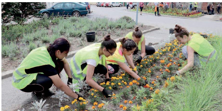
A virágágyásokat gondozásában is részt vesznek a diákok.

A kormány idén is meghirdette a nyári diákmunka programot, amiben 16-25 év közötti nappali tagozatos tanulók vehetnek részt, július 1. és augusztus 30. között. A program indításának célja, hogy csökkentsék a fiatalok inaktivitását, valamint, hogy elősegítsék a munkatapasztalat és a jövedelem szerzését. 2020-ban több mint 21 ezer fő jelentkezett a felhívásra. Szerencsen összesen 60 diáknak biztosítottak munkalehetőséget, a Szerencsi Városgazda Non-Profit Kft-nél. A fiatalok nagy segítséget jelentenek ebben az időszakban. Részt vesznek a város közterületek megszépítésében, a virágágyások gondozásában. Ezenfelül a cég tulajdonában lévő nyolc hektáros földterület gyomtalánításában, valamint a szőlőterületeken felmerülő munkafolyamatokba is bekapcsolódnak. A diákok naponta 6 órában dolgoznak, folyamatos felnőtt felügyelet mellett.