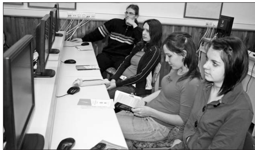
A végzős tanulóknak február 15-ig kell dönteniük a továbbtanulásukról.

A felsőoktatási felvételi határidő közeledtével egymást követik a tájékoztatók a különböző egyetemek és főiskolák kínálatáról a Bocskai gimnáziumban. A középiskola 225 végzős diákja így helyben gyűjthet