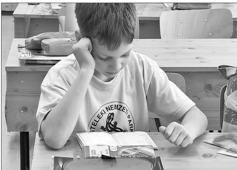
A félévi bizonyítványok szigorúbb érdemjegyeket tartalmaznak.