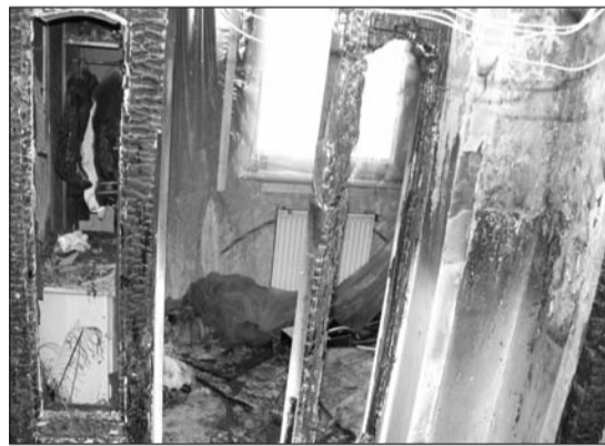
A kiégett lakásból vitték el a bankókat a tettesek.

Egy elektromos meghibásodás miatt keletkezett lakástűz után eltűnt néhány ezer euró egy sátoraljaújhelyi ingatlanból. Anyagi bizonyosnak látszott, hogy nem a lángok falták fel a pénzt.