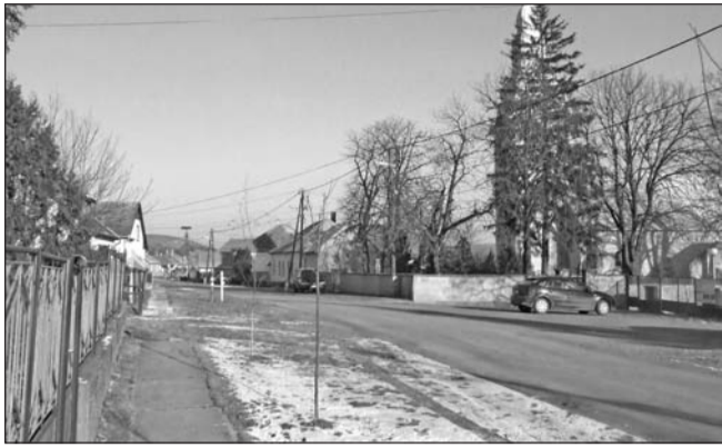
A tervek szerint megújul az ondi településrész központja.

Két pályázatot nyújtott be a január 15-ei beadási határidőig a szerencsi önkormányzat a nemzeti diverzifikációs programra. A képviselő-testület a hazai és európai uniós pénzügyi alapról a Gyári kert parkrekonstrukciójára és az ondi településközpont fejlesztésére több mint 76 millió forint támogatást igényel.