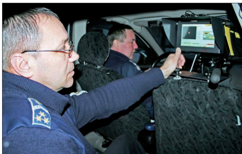
A magyar gyártmányú lézeres műszer szélsőséges fényviszonyok között is jó minőségű fényképet készít a gyorsajtókról.

A magyar gyártmányú lézeres sebességmérő nem videofelvételt, hanem egyetlen képet készít és azt műholdas kapcsolaton keresztül automatikusan azonnal továbbítja feldolgozásra az Országos Rendőr-főkapitányságra. Ezzel gyorsabbá válik az eljárás és a gépjármű üzembentartójának is hamarabb kézbesíti a posta az objektív felelősség alapján kiszabott, a büntetést tartalmazó határozatot. Egy-egy ilyen készülék 4,5 millió forintba kerül, állványra szerelve és a személyautó fejtámlájához rögzítve egyaránt használható. Az új mellett azonban a régebbi típusú berendezések is szolgálatban maradnak.