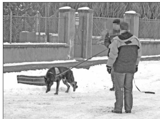
Ma sem ismert, hogy ki okozta az idős asszony halálát Mezőzomboron.

Egy éve annak, hogy 2009. január 12-én hajnalban Mezőzomboron a családi háza előtt a járdán fekvő talált rá a tejet kihordó helyi lakos egy 82 éves, egyedül élő asszonyra. A testén bántalmazási nyomokat viselő, kihüléshez közeli állapotban lévő sértett a kórházba szállítás közben elhunyt. Az ügyben a Borsod-Abaúj-Zemplén Megyei Rendőr-főkapitányság forrnyomos csoportja végezte a helyszíni szemlét és a tanúmeghallgatásokat. Az ügyben halált okozó testi sértés miatt indult eljárás. A megyei rendőrfőkapitány az elkö-