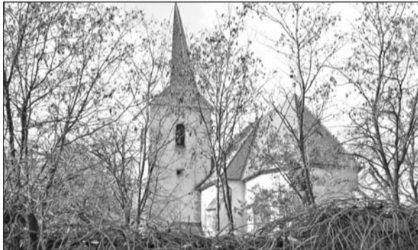
A református templom kívül és belül megújul.

Sorozatunkban azokat a beruházásokat mutatjuk be, amelyet az elkövetkező időszakban jelentős pályázati támogatás felhasználásával valósít meg az önkormányzat Szerencsen.