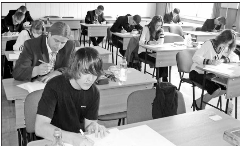
A szerencsi középiskolában kiemelt figyelmet fordítanak a diákok képességeinek kibontakoztatására.

Az ötödik évfolyamon OKJ-s képzést biztosítanak marketing és reklámügyintéző szakmában. A gimnázium nagy hangsúlyt fektet a testi nevelésre is. Itt avatták fel a megye első középiskolai műfüves labdarúgópályáját, amelynek a világitása este is biztosítja a feltételeket a sportolásra. Emellett két salakos teniszpálya, kondicionáló- és tatamitermek, szaxofon szerepel a kínálatban. A városi uszodába közvetlen az átjárásuk, így a testnevelés órák egy részét ott tartják. Fiú kosárlabdacsapatuk 1998-tól szinte minden évben az országos döntőbe került. Több értékes helyezést ért el a mostani gárda tette fel a koronát a bajnoki cím megszerzésével. A lányoknak sem kell szégyenkezniük, akiknek a legjobb eredményük az ezüstérem.