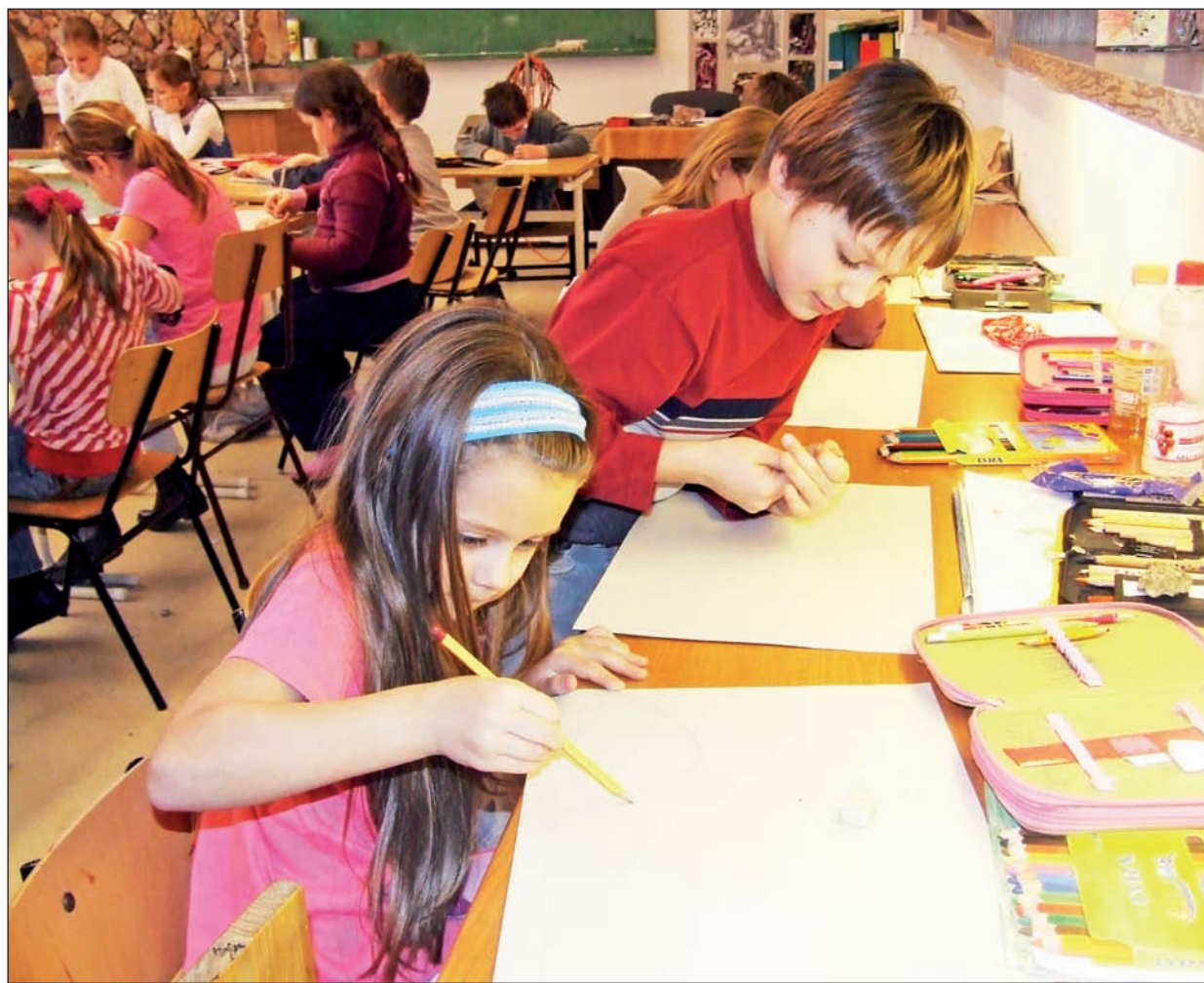
A képző- és iparművészet alapjaival több mint száz diák ismerkedik.

Közel három esztendeje annak, hogy a városban megvalósult intézményi átszervezéssel létrejött helyi alapfokú oktatási intézményben a művészeti iskola. Az idei tanévben több mint ötszáz diák kapcsolódott be a különböző szakágak munkájába, hogy délutáni foglalkozásokon gyarapítsák zenei, szín- és bábjáték, néptánc, valamint képző- és iparművészeti ismereteiket.