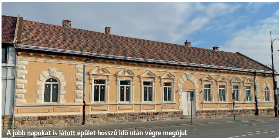
A jobb napokat is látott épület hosszú idő után végre megújul.