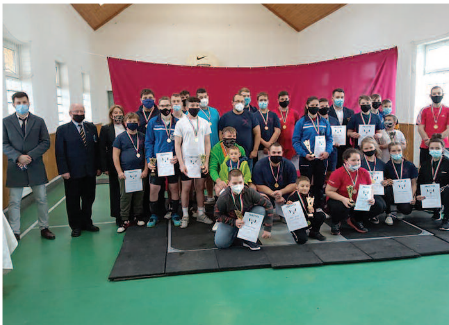
A szerencsi sportolók remek teljesítményt nyújtottak.