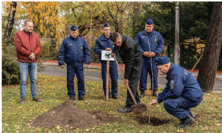
A fa ültetésével a koronavírus-járvány elleni védekezésre hívják fel a figyelmet.

A Nógrád Megyei Rendőr-főkapitányság ebben az évben indította el kihívását, amelynek lényege, hogy a koronavírus elleni küzdelemre történő figyelemfelhívás céljából facsemetéket kell elültetni minél több településen. A fa az évek múlásával terebélyesedik, egyre magasabbra nő, így szimbolizálja az életet, annak megújulását és legyőzhetetlenségét. A kezdeményezés célja, hogy figyeljünk egymásra, előzzük meg a vírus terjedését! A kihíváshoz az ország valamennyi rendőrkapitánysága csatlakozott. Ennek jegyében november 5-én a Szerencsi Rendőrkapitányság, a Bocskai István Katolikus Gimnázium és Szerencs Város Önkormányzata az Északerdő Zrt. támogatásával közösen egy juharfát ültettek el a hivatal épülete előtt. Ugyanakkor a megyében lévő további kilenc rendőrkapitányság is ültetett egy-egy fát a székhelyi településeken – a települések vezetőivel, képviselőivel együtt –, amelyek a széles körű összefogást is jelképezik.