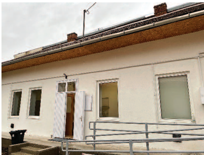
Az új irodának köszönhetően modern környezetben dolgozhatnak a szociális dolgozók.

A Szerencsi Hírek korábban már többször beszámolt arról, hogy megújul a Jókai úton található I. számú háziorvosi rendelő. A felújításokkal párhuzamosan Szerencs Város Önkormányzata megvásárolta a rendelő mögötti ingatlant, hogy ott a Szerencsi Többcélú Kistérségi Társulás keretében működő házi segítségnyújtás és támogató szolgálat munkatársainak megteremtse a szükséges infrastruktúrát. A tavalyi esztendőben a