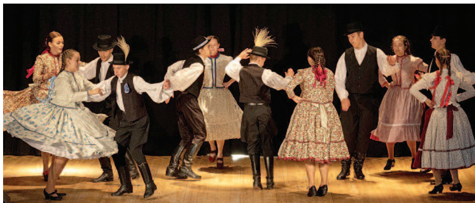
A jubileumi gálán teltházas közönség előtt táncoltak az együttes tagjai.

– Természetesen a tánc, viszont ez sem örök, egy idő után elfáradt az ember. Mostanában egyre több időt töltök az új hobbjaimmal. Szeretek különböző péktermékeket köztük kenyeret, kalácsokat sütni. Természetesen ez is kapcsolódik valamilyen szinten a néphagyományokhoz, úgy csinálom ahogy ősünk régen. Semmilyen adalékanyagot, tartósítószeret nem használok. Szeretnék majd a jövőben ezzel többet foglalkozni, még több tapasztalatot szerezni, finom, egyedi termékeket készíteni.