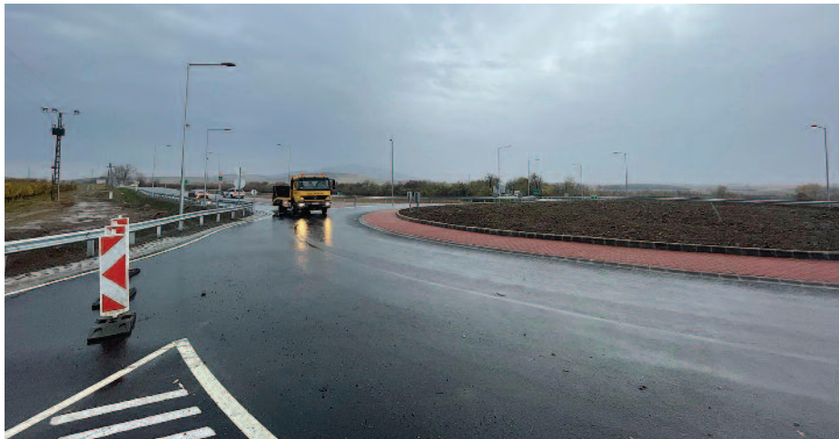
A körforgalomnak köszönhetően biztonságosabbá vált a közlekedés.

Hivatalosan is átadásra került november 4-én a tokaji borvidék egyik legfontosabb kereszteződésében épült körforgalom, ami kényelmesebb és biztonságosabb elérhetőség biztosít Sátoraljaújhely, Tarcal és Szerencs irányába. A beruházás keretében a 37. számú főút teljes pályaszerkezetét kicserélték Szerencs irányába 230, Sátoraljaújhely irányába 160, illetve a 38. számú főúton Tarcal irányába 115 méter hosszan, továbbá Sárga Borház étterem felé 80 méter hosszan. A körforgalmat energiatakarékos közvilágítás világítja meg, és megújult a közelben található tengelysúlymérő állomás is. A beruházás tavasszal a te-reprendezéssel kezdődött, nyáron már az épít-