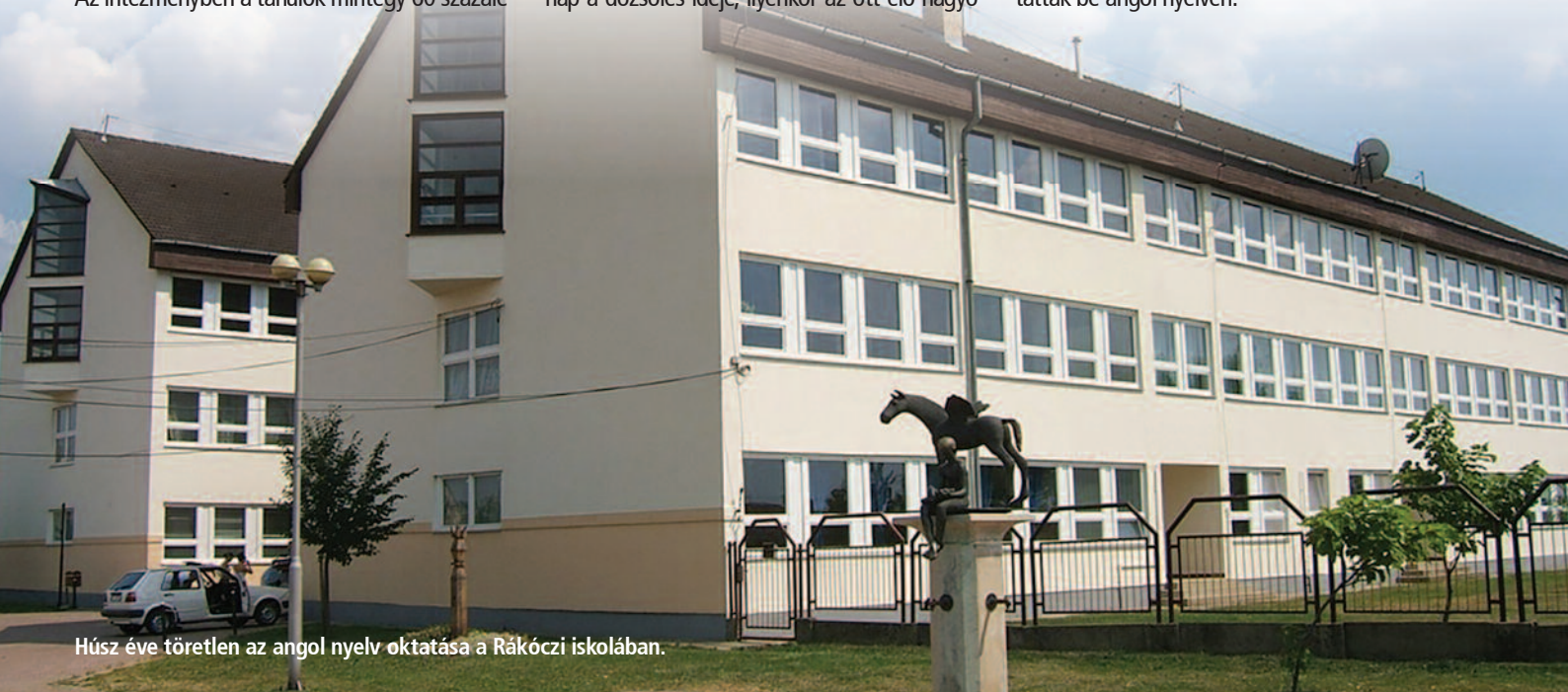
Húsz éve töretlen az angol nyelv oktatása a Rákóczi iskolában.