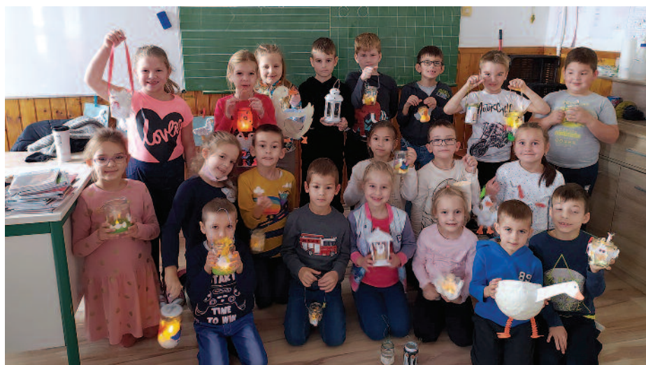
A Rákóczi iskola diákjai különböző Márton-napi kreatív ötletekkel készültek.

legenda szerint éppen a mai Franciaország területén volt, amikor egy didergő koldus a segítségét kérte. Az önzetlen katona kettévágta talárját, és felét a szegény embernek adta. Akkoriban sokan úgy gondolták, a koldus maga Jézus Krisztus volt. Ezt követően hamarosan kilépett a légióból, és papként szolgált tovább. A legenda szerint Márton csak egyszerű papként képzelte el az életét, nem szeretett volna Tours (egy város Franciaország nyugati részén) püspöke lenni és amikor eljöttek érte, hogy megtartsák az avatási szertartást, inkább egy libaóliba menekült. Csak hogy a libák hangos gágogásukkal elárulták Márton rejtekhelyét, s innentől nem kerülhetett el a neki szánt sorsot így hát, tours-i Mártonból előbb püspök, majd szent lett. A libaevés hagyománya egyrészt innen eredeztethető. Másrészt a római időkben november 11-én kezdődött az év utolsó negyede. Ezen a napon jókat ettek és ittak az újborból és az új termésből. Ha tehették Mars, a háború istene szent madarát, a ludat ették. A magyar hagyomány szerint Szent Márton Magyarország második védőszentje Szűz Mária után, mivel Márton álmában Szent István országot segítette egy alkalommal. A Márton-napi lakoma után kezdődik a 40 napos böjt, ezért úgy tartja a mondás: „Aki Márton napon libát nem eszik, egész éven át éhezik”. A november 11-i lámpás felvonulás hagyománya német nyelvtérületről honosodott meg Magyarországon. A fáklya fénye szimbolizálja a jó cselekedeteket, amiket Szent Márton az emberekért tett.