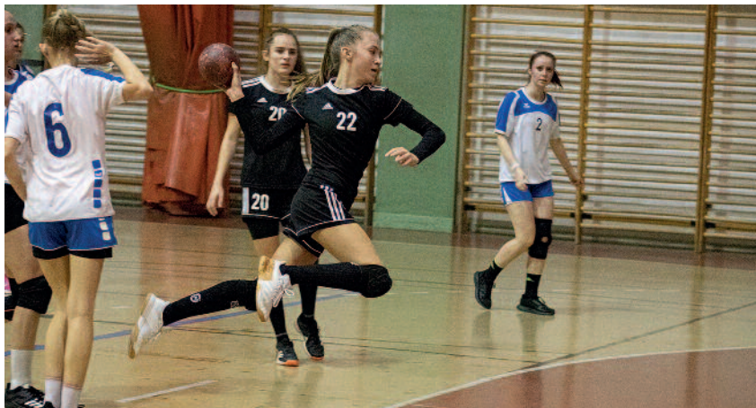
A szerencsi lányok támadásai az ellenfél részéről megállíthatatlanok voltak.

A Szerencs VSE női ifjúsági kézilabdacsapata november 14-én magabiztos játékkal megnyerte a Mezőkeresztes VSE elleni mérkőzést. A Kulcsár Anita Sportcsarnokban megtartott találkozón a szerencsiek már a mérkőzés elején megszerezték a vezetést. A házigazdák remekül védekeztek, a mezőkeresztesiek csak nehezen tudtak gólt dobni. A szerencsiek ezzel ellentétben gyorsan megtalálták a réseket a védelmen és pontos támadásokkal rendre betaláltak a vendégcsapat hálójába. A játékosok 15–3-as szerencsi vezetésnél mentek pihenőre. A második féldő elején csökkent a Mezőkeresztes VSE hátránya, ám a házigazdák gyorsan visszaállították a több mint tízgólós előnyt. A találkozót végül magabiztosan nyerték a szerencsiek. A Női Ifjúsági III. D-osztály 8. forduló végeredménye: Szerencs VSE–Mezőkeresztes VSE 27-12 (15-3).