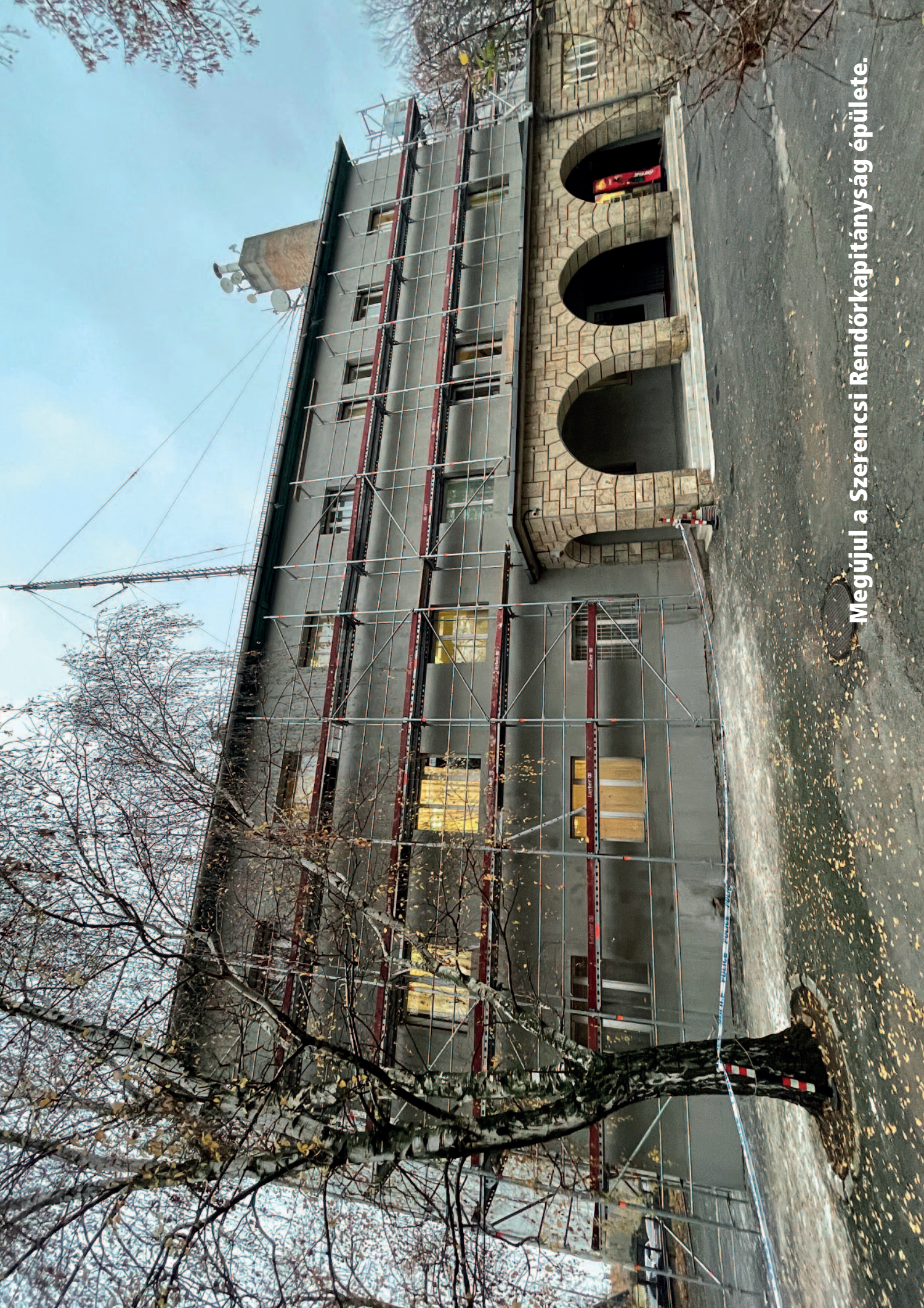
Megújul a Szerencsi Rendőrkapitányság épülete.