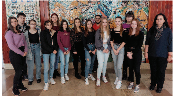
A bocskais diákok kítűnően szerepeltek a versenyeken.