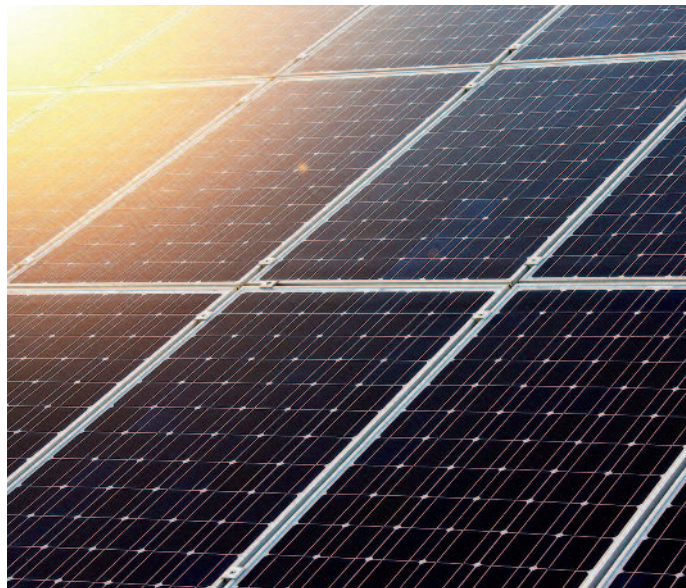
Növekszik a megújuló energiaforrások térfogata. (Fotó: illusztráció.)