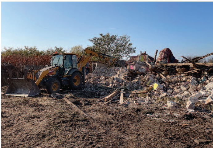
A korábban többször is kigyulladt épület helyén épül fel a református óvoda.

Református Egyházkerület (TIREK) püspöki titkárával. Az épület ugyanis a TIREK tulajdonában van. A bejáráson akkor elhangzott, hogy a ház elbontását követően református óvodát építenek a területen. Az engedélyeket már megkapták és a törmelékek eltakarítása után még az idén megkezdik a kivitelezést, hogy a tervek szerint legkésőbb 2022. december 31-ig elkészüljön az óvoda.