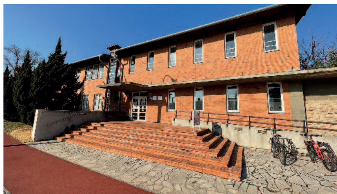
A tanuszoda felújításához megközelítőleg 150 millió forintra lenne szükség.

bírálását. A tankerületi központ és a pedagógia szakszolgálat dolgozói jelenleg biztonságban vannak, azonban számítani kell arra, hogy a tél beköszöntével a nagyobb havazás esetén a vastagabb hótakaró súlya alatt veszélyessé válhat a födém” – nyilatkozta a polgármester. Az úszás edzéseken résztvevő gyerekeket jelenleg heti három alkalommal a tokaji uszodába szállíttatja az önkormányzat. Mivel a tanuszoda biztonságosan nem üzemeltethető, ezért továbbra sem fogadhat látogatókat. A polgármester hangsúlyozta, hogy a jelenleg a baleset elkerülése a legfontosabb, ami minden ezzel ellentétes véleményt és megnyilvánulást felülír.