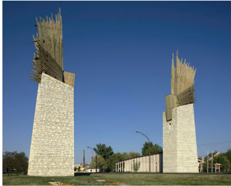
A Világörökségi Kapuzat Szerencs jelképévé vált.