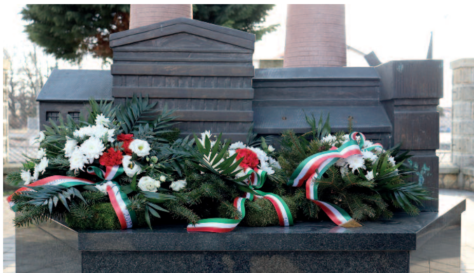
Koszorú az emlékművön.

Szerencs Város Önkormányzata megemlékezést tartott március 10-én a Szerencsi Cukorgyár bezárásának tizennegyedik évfordulóján a Cukorgyári Emlékparkban. A Mátra Cukor Zrt. német tulajdonosa 2008. március 10-én jelentette be, hogy megszünteti a szerencsi cukorgyártást, ami akkor óriási törést jelentett a városnak. A gyár ugyanis Szerencs életének, fejlődésének meghatározó ipari létesítménye és egyben jelképe is volt. A szerencsi és környékbeli emberek több generációja kereste itt a napi betevőjét a működés több mint száz éve alatt. A lebontás