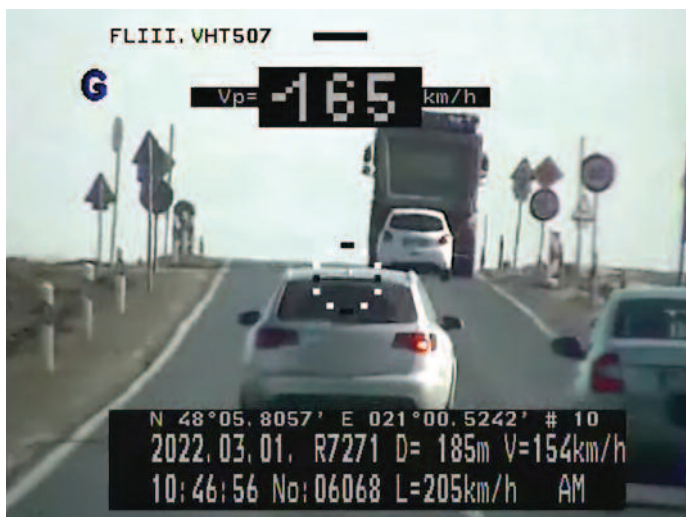
A vétkes sofőr mindenkit veszélybe sodort.