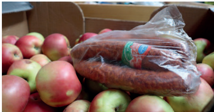
Közel 1 millió forint értékű adomány gyűlt össze.

Éppen három hete annak, hogy Oroszország megtámadta Ukrajánát, ami a szomszédos államban a háború kitérését jelentette. Azóta emberek százezrei menekülnek a lövedékek-, bombák-, rakéták életeket követelő és anyagi javakat pusztító támadásai elől, kettészakítva családokat, hátrahagyva otthonokat.