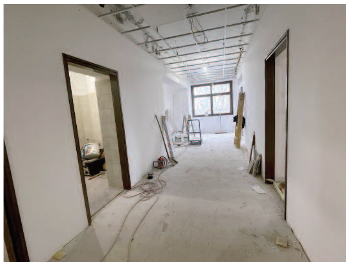
A jövőben folytatódik a felújítás.