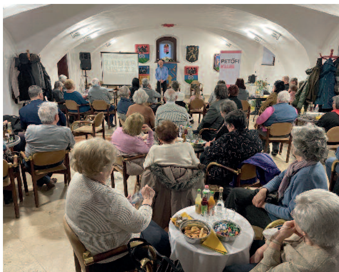
Az előadásra teljesen megtelt a Rákóczi-vár lovagterme.

A rímek koronázatlan királyának, Romhányi József születésének 101. évfordulója alkalmából emlékestet rendeztek március 4-én a szerencsi Rákóczi-vár lovagtermében. Az előadást Kretoics István, a Szerencsi Kisgép- és Fénycentrum vezetője tartotta, aki Romhányi verseket szavalt, és a költő életének főbb mérföldköveit mondta el. A több mint két órás előadásra sokan voltak kíváncsiak, a terem teljesen megtelt. Elhangzott, hogy rengeteg a költő által alkotott mondat él a köztudatban, a szerző neve viszont alig-alig ismert, pedig elég csak a vicces állatverseire vagy meséire gondolni. Verseit könnyed, intelligens humor lengi át, ami egyaránt szórakoztató lehet fiataloknak és felnőtteknek egyaránt. Ez annak köszönhető, hogy bravúros verselési technikával szó- és rímjátékok ezreivel tűzdelte tele műveit, amiért országszerte rábiggyesztették a „Rímhányó” jelzőt. Kretoics István részletesen ismertette a költő életének