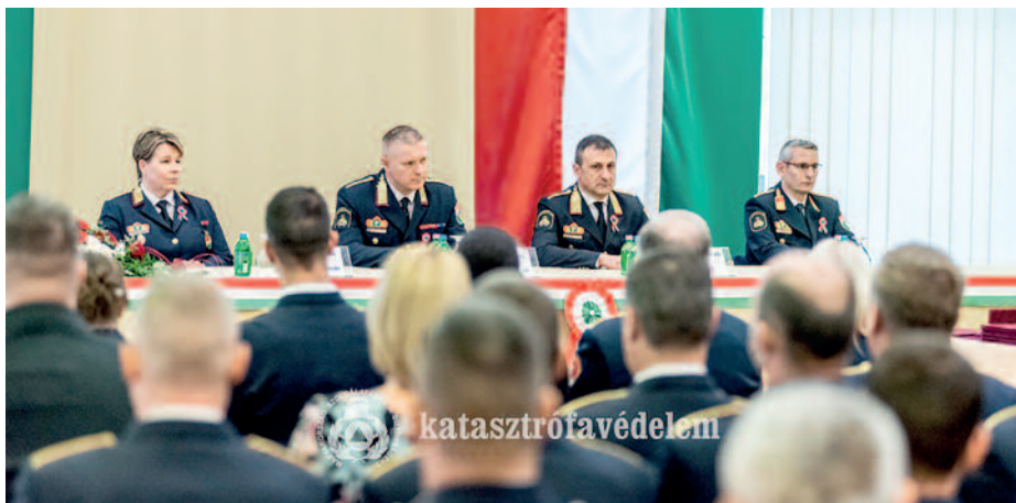
A szerencsi tűzoltók az ország legjobbjai közé tartoznak.

Az 1848–49-es forradalom és szabadságharc tiszteletére rendezett megemlékezést a katasztrófavédelem március 11-én Budapesten. Az ünnepség alkalmat adott arra is, hogy a jelenkor legjobbjai is elismerésben részesüljenek. A BM Országos Katasztrófavédelmi Főigazgatóság vezetői, a meghívott vendégek és az elismerésben részesülők a Himnusz elhangzása után Erdélyi Krisztián tűzoltó dandártábornok, műveleti főigazgató-helyettes köszöntőjét hallgatták meg. A szónok felidézte azokat a szimbólumokat, érzéseket, amelyeket az emberek általában a március tizenötödiki ünnephez társítanak. Beszélte arról, hogy százhetvennégy éve azon a napon a magyarság számára fontos történelmi események kezdődtek, amelyekkel a magyar nemzet jelentős lépést tett a függetlenség elnyerése, a feudális társadalmi rend felszámolása felé. A főigazgató-helyettes azzal zárta köszöntőjét, hogy a vértanúkra, hősökre emlékezve most van itt az ideje, hogy a magyarok fejet hajtsanak mindazok