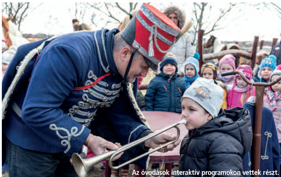
Az óvodások interaktív programokon vettek részt.